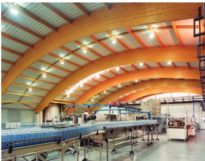
Usine d'embouteillage - Sources Wattwiller

Depuis plus de 40 ans, nous réalisons des structures en bois lamellé collé, et ce pour tous types d'applications (industriels, sportifs, agricoles, publics...).