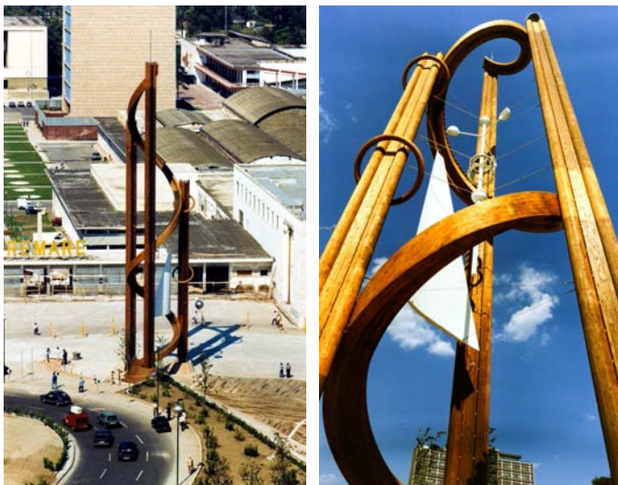
Tour du Temps Structure en Mélèze - hauteur 35 m - Naples (Italie)

Nous concevons et réalisons des projets complexes nécessitant savoir-faire et haute technicité. L'innovant système d'assemblage Résix® en est la preuve.