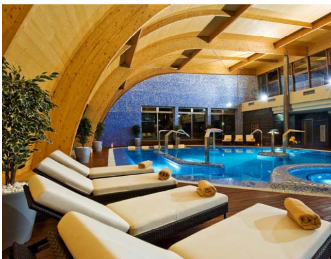
Piscine et Spa - Espagne

Notre savoir-faire repose sur une technique de fabrication du lamellé collé bien maîtrisée. Nos équipes apportent un soin particulier à chaque détail, pour obtenir un produit fini de grande qualité.