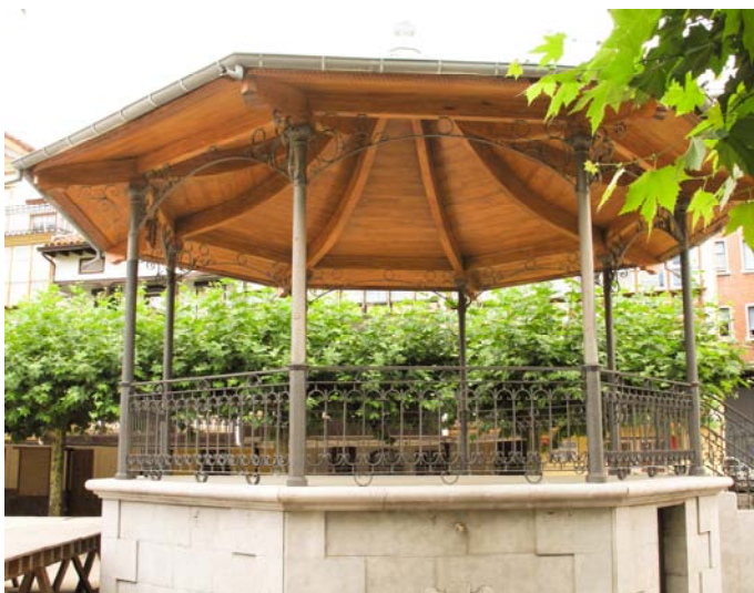
Structure en chêne lamellé collé Panneaux isolants Sapisol® avec sous-face chêne Kiosque - Espagne

Nous travaillons régulièrement des bois performants comme l'épicéa ou le pin mais pour des ouvrages plus prestigieux nous sélectionnons des essences nobles telles que le chêne, le hêtre, le frêne, le châtaignier ou le red cedar.